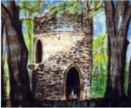
Der Hexenturm im Demandt'schen Park (Original: Brigitte van Loh-Wenzel)

Geduld ist die Eigenschaft, die am dringendsten benötigt wird, wenn man sie verliert. C.M.Williams