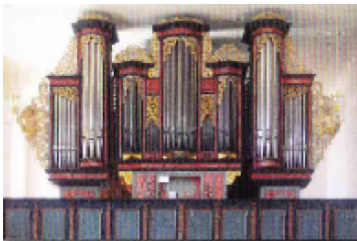
300 Jahre Macrander-Orgel im Kloster