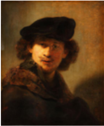
Rembrandt - Selbstbildnis