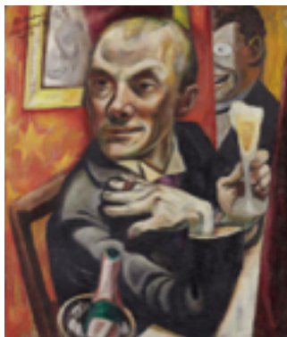
Max Beckmann Selbstbildnis mit Sektglas