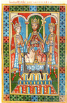
Kaiser Friedrich Barbarossa

Alle Menschen sind klug, die einen vorher, die anderen nachher. Voltaire